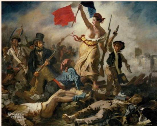
Eugène Delacroix Wolność wiodąca lud na barykady , 1830