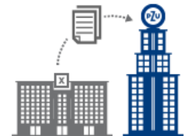
PZU zajmuje się wszystkimi formalnościami