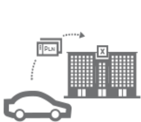
Pan Robert wykupił polisę OC u ubezpieczyciela X