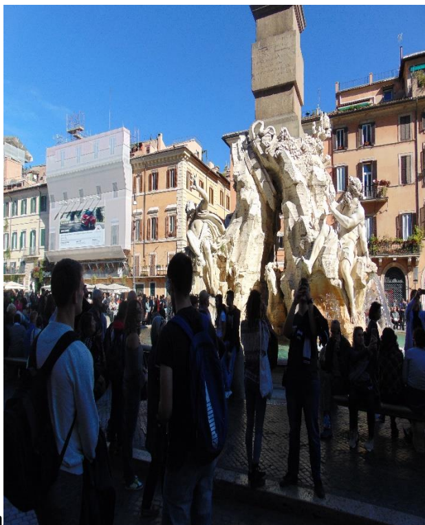
Navona, Zamek Św. Anioła

Ponadto uczniowie wzięli udział w ramach przygotowania kulturowego w wycieczce do Watykanu, gdzie zwiedzili Bazylikę Św. Piotra oraz w wycieczce do Rzymu -zwiedzając Koloseum, Panteon, Schody Weneckie, Fontannę di Trevi, Forum Romanum, Piazza